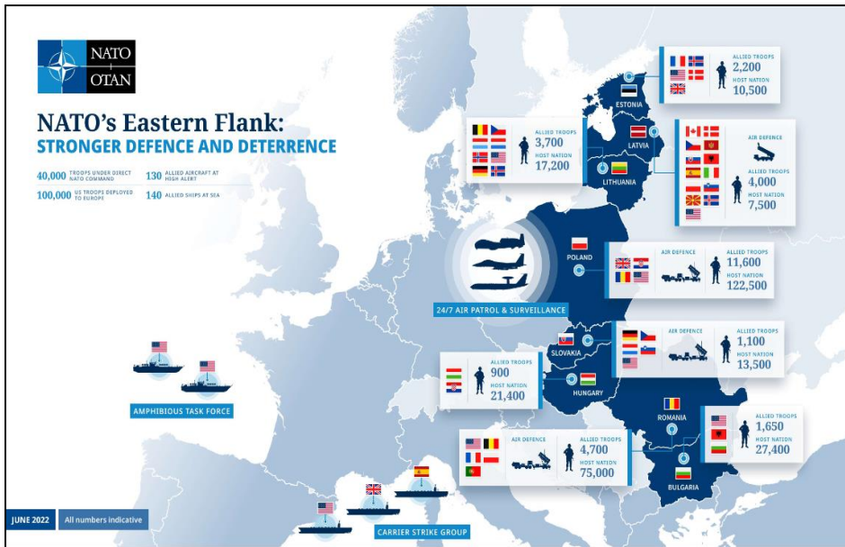
Figure 1. Number of deployed and local troops, June 2022 23