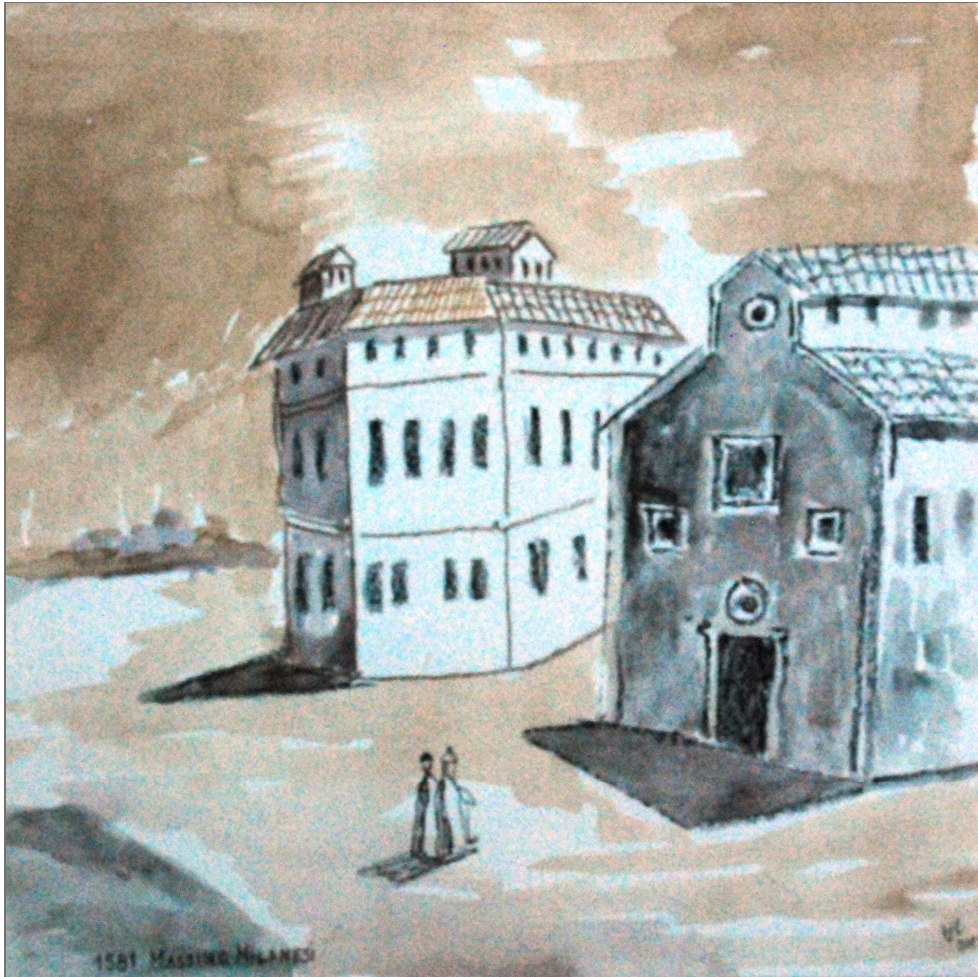
Fig. 1. Prima Universitate