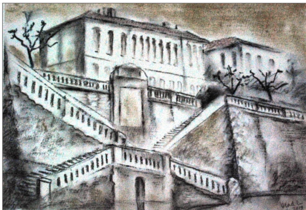
Fig. 3. Clinicile au peste 100 de ani