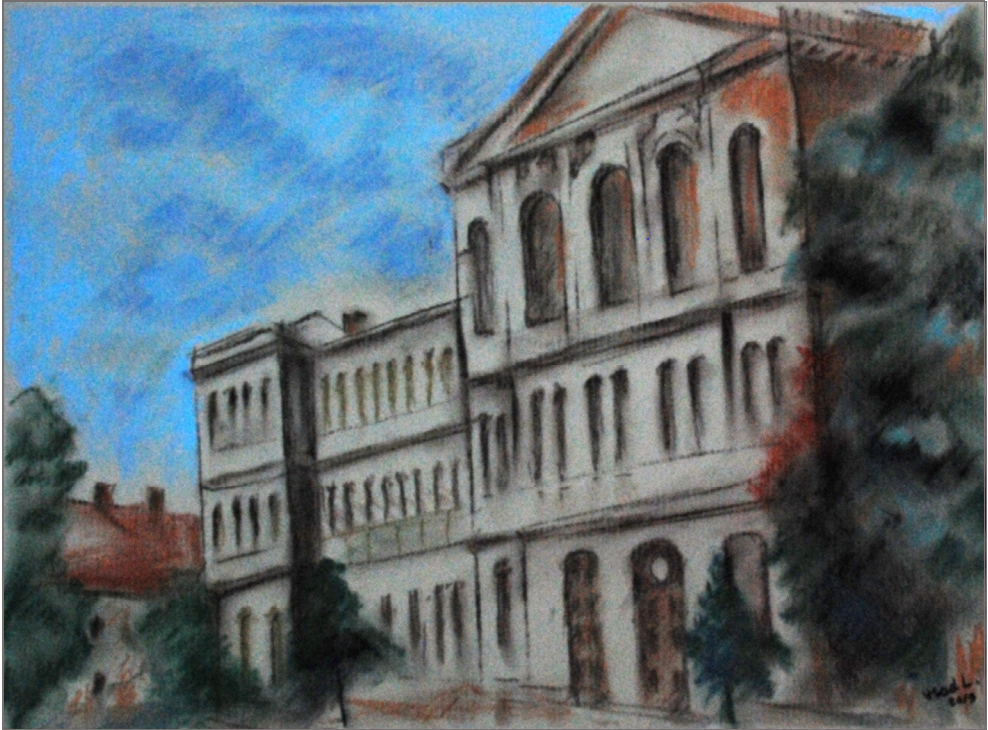
Fig. 4. Început de an universitar