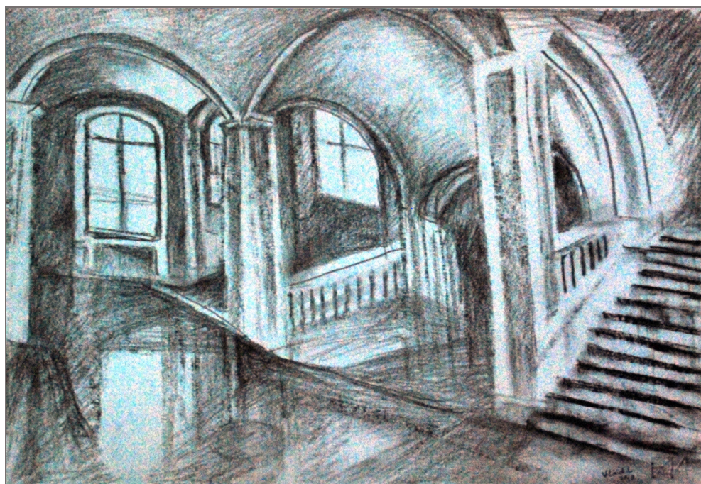
Fig. 6. Pe coridoarele Almei Mater