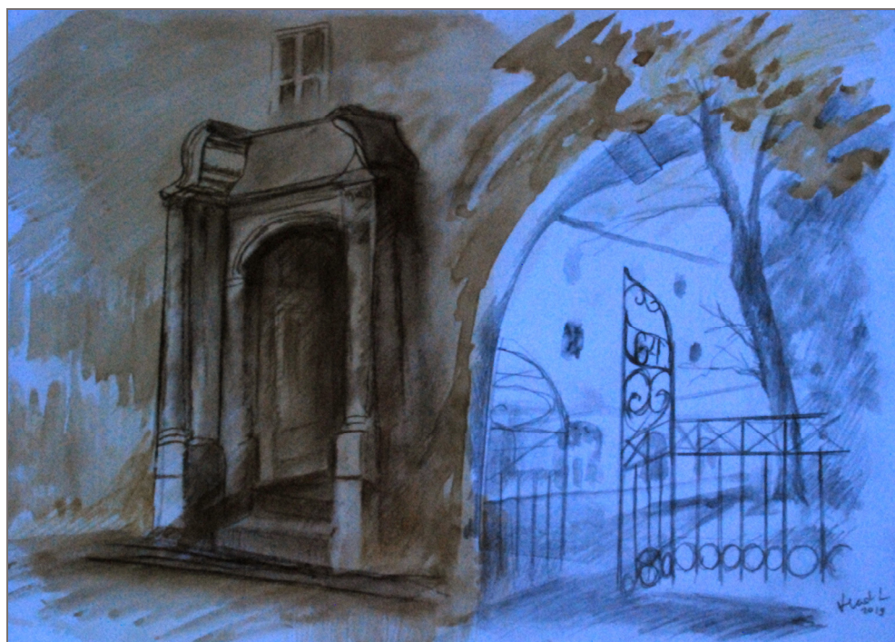
Fig. 2. Convictus Nobilium