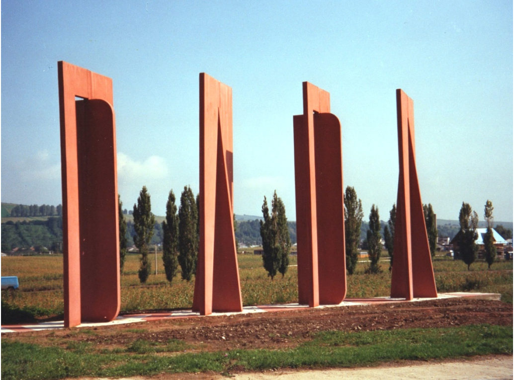
Monumentul DADA din Moinești, în 1996