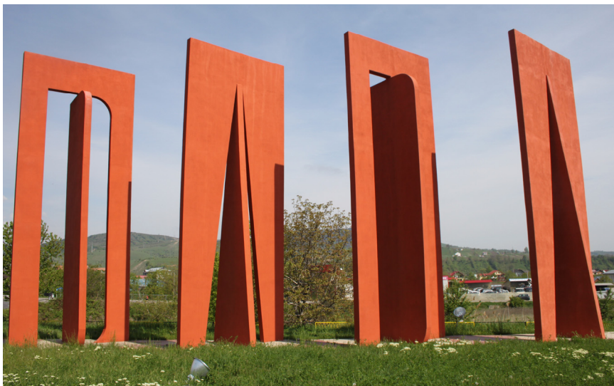
Buletinul DADA – detaliu. Monumentul DADA în 2016