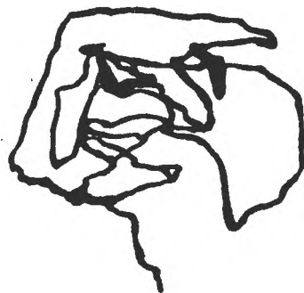
Fig. 5. Traseul oculomotor al parcurgerii labirintului de către un subiect care aparține tipului de explorare vizuală insuficient organizată, „inert“.

2. În cazul probei labirintului „zona căutării“ este cu atît mai restrînsă și mai adecvată cu cît în găsirea secvențială a ieșirilor din labirint sînt implicate simultan atît informațiile vizuale — periferice și foveale —, cît și informațiile kinestezice ale mîinii, provenite prin trecerea grafică a labirintului.