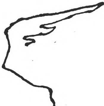
Fig. 2. Traseul mișcărilor oculare obținut prin trecerea pur vizuală a labirintului fără greșeală, în 25 sec.

1. Importanța informațiilor vizuale periferice în declanșarea și organizarea mișcărilor oculare necesare pentru parcurgerea labirintului. Rezultatele obținute ne arată că în parcurgerea pur vizuală a labirintului, precum și în parcurgerea grafică a acestuia, subiectul rezolvă rapid proba — prin mișcări oculare, respectiv prin mișcări grafice adecvate —, dacă reperează de la început prin vederea periferică primele ieșiri libere ale labirintului (fig. 2 și 3). Aceasta este posibil datorită faptului că ieși-