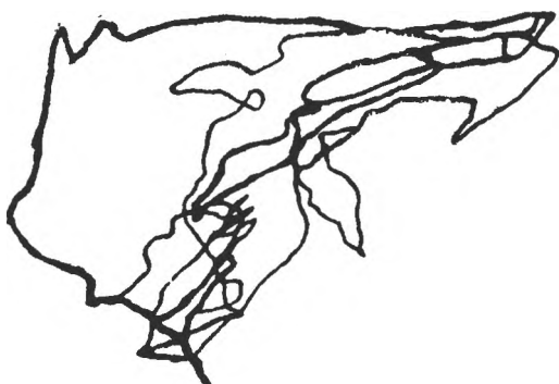
Fig. 4. Traseul mișcărilor oculare în cazul în care subiectul nu coroborează informațiile foveale cu cele survenite prin vederea periferică (timp de explorare necesar parcurgerii labirintului: 80 sec).

sare parcurgerii labirintului suferă perturbări. În aceste cazuri zona căutării este largă, mișcărilor oculare sînt mult prea numeroase și haotic repartizate (fig. 4), iar la unii subiecți și în rezolvarea grafică se întîlnesc mai multe intrări în coridoarele infundate ale labirintului.