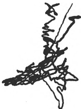
Fig. 5. Tip de explorare vizuală insuficient organizată corespunzător unui stil de activitate cognitivă „pripit“ (Subiect M.A., 22 ani; timp de explorare: 1 min 40 sec.)