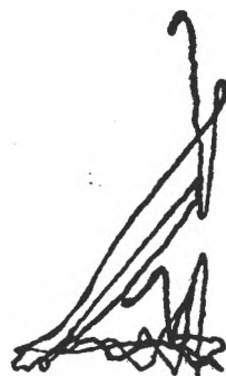
Fig. 4. Tip de explorare vizuală organizată (Subiect C.V., 23 ani; timp de explorare: 45 sec.)

Insuficienta elaborare a strategiei exploratorii, ca urmare a stilului de activitate cognitivă „pripit“, se reliefează și în traseele explorării vizuale. Astfel, se observă multitudinea mișcărilor oculare și a „zonelor de fixație“ care se suprapun destul de haotic (fig. 5).