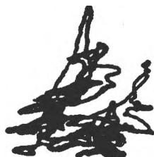
Fig. 6. Tip de explorare vizuală insuficient organizată, corespunzător unui stil de activitate cognitivă „inert“ (Subiect P.A., 22 ani; timp de explorare 1 minut și 10 secunde)

b) Tipul de explorare vizuală insuficient organizată, corespunzător unui stil de activitate cognitivă „inert“. La subiecții aparținând acestui tip strategia exploratorie se formează lent și este insuficient precizată. Mișcările oculare și „zonele de fixație“ ale privirii nu sînt suficient organizate. Subiectul explorează de mai multe ori aceleași elemente, perseverînd pe aceleași trasee și zone ale căutării. Aceste caracteristici ale explorării vizuale sînt determinate de faptul că ipotezele de rezolvare se construiesc incert și lent, iar unele, deși ineficiente, sînt menținute, revenindu-se asupra lor (perseverare).