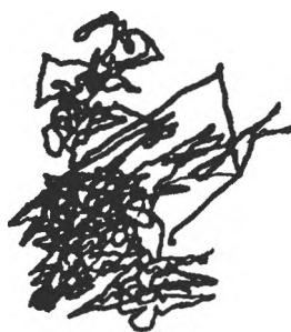
Fig. 3. Traseu al explorării vizuale în 2 min. din prima variantă experimentală (subiect P.M., 23 ani)