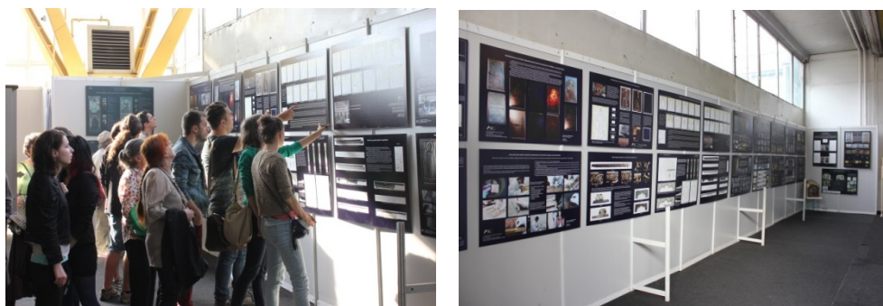
Expoziția absolvenților UAD Cluj-Napoca, specializarea conservare și restaurare, Expo Transilvania, 2014

În ordinea cronologică a operațiunilor procesului de conservare și restaurare, examinarea este prima și cea mai importantă etapă în reevaluarea istorică, artistică și tehnică a unei picturi murale. În general, investigațiile invazive sau non-invazive care preced o restaurare au ca obiectiv achiziționarea de date referitoare la: istoria monumentului și a decorațiilor murale (date de ordin istoric), tehnica și metodologia de executare a picturilor, inclusiv etapele și ordinea efectuării lor, materialele constitutive și structura lor, istoria conservativă a obiectului (individualizarea și recunoașterea intervențiilor precedente, natura materialelor de restaurare), procesele patologice care compromit stabilitatea în studierea stadiului de conservare și a produșilor proceselor de degradare.