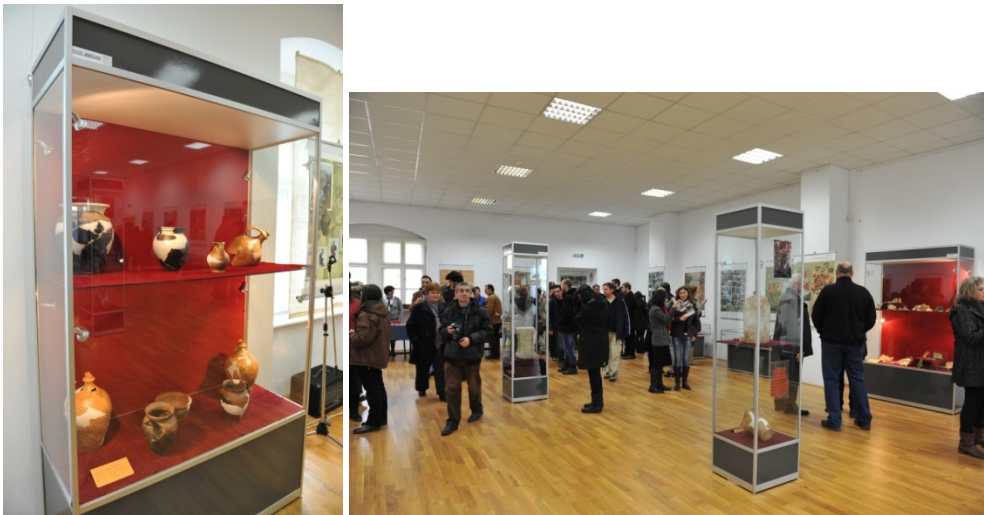
Expoziție de restaurare: Clujul Arheologic , Muzeul de Istorie al Transilvaniei, 2015.

Restauratorul se află mereu între problemele teoretice și noile materiale și metodologii de intervenție adăugându-se la acestea și partea economică. Astfel, un restaurator practician trebuie să fie foarte atent la teoria generală a restaurării picturilor murale, la noile tendințe teoretice, pentru a putea să le coreleze la noile materiale aplicate în metodologii, dar în același timp să păstreze o utilizare minimală a acestora sub regula minimei intervenții asupra unui artefact așa cum reținem cu toții din cărțile lui Cesare Brandi, Teoria dell restauro și Teoria e pratica dell restauro .