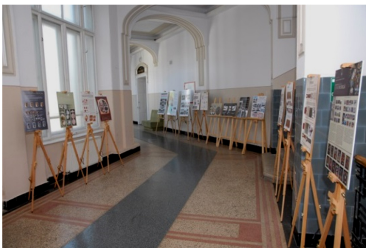
Simpozion: Patru decenii de funcționare a Sistemului Românesc de Conservare și Restaurare a Patrimoniului Cultural Național, Muzeul Etnografic al Transilvaniei, 2015.

Astfel, studenții de la Universitatea de Artă și Design Cluj-Napoca învață importanța unui proiect de restaurare și nu în ultimul rând cum să conceapă un astfel de proiect. Deoarece lucrează pe șantiere de restaurare, licența lor constă într-un proiect aplicat de restaurare ce are un caracter pluri-disciplinar.