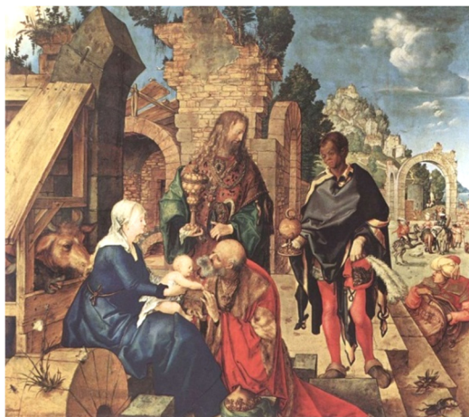
Albrecht Dürer, Închinarea Magilor , tempera pe lemn, 1504, Galleria degli Uffizi, Florența.

Mantegna alege în redactarea motivului plastic o compoziție privită dintr-o perspectivă cu totul diferită de majoritatea artiștilor. El aduce în planul principal evenimentul, mărand personajele pe care le prezintă busturi și portete. Înscrișă într-o formă geometrică trunghiulară, compoziția compactă unește prin axele ei diagonale magii, Feciora și Pruncul, precum și pe Iosif, aflat în stânga, sus. În gesturi de adorație sunt surprinși magii, doi dintre ei pictați cu turbane frumos colorate. Desenul grațios cu valențe monumentale influențat de studiile după statuile antice, caracterizează personajele.