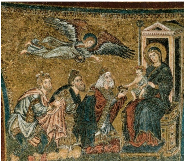
Jacopo Torriti, Închinarea Magilor , mozaic, sec. al XIII-lea, Basilica Santa Maria Maggiore, Roma.