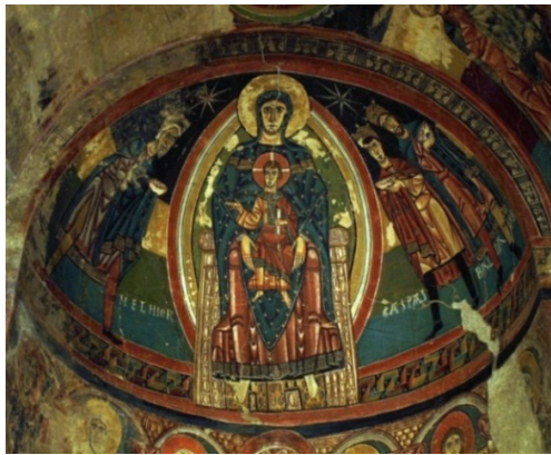
Închinarea Magilor , frescă, sec. al XII-lea, Biserica Taull.

Manuscrisul de la Biblioteca Apostolica Vaticana aduce o notă distinctă în organizarea componistică a scenei, prin prezența coroanelor pe capetele Regilor veniți din Răsărit.