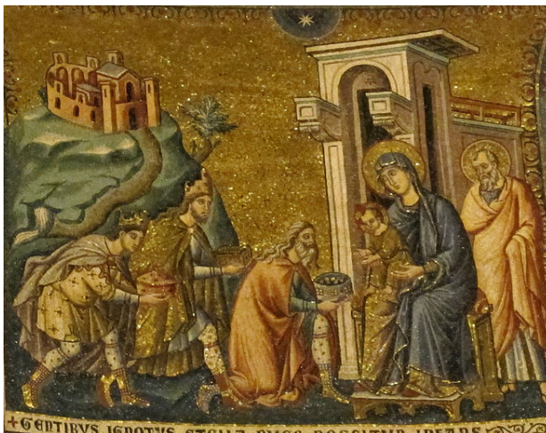
Pietro Cavallini, Închinarea Magilor , mozaic, sec. al XIII-lea, Basilica Santa Maria in Transevere, Roma.

Preluând schema compozițională a vechilor modele din catacombe și sarcofage, tema Închinării este tratată cu mult interes de o serie de creatori începând din spațiul postbizantin și până în zorii Barocului.