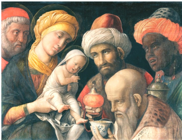
Andrea Mantegna, Închinarea Magilor , tempera pe lemn, 1497-1500, Getty Museum, Los Angeles.

Mantegna alege în redactarea motivului plastic o compoziție privită dintr-o perspectivă cu totul diferită de majoritatea artiștilor. El aduce în planul principal evenimentul, mărand personajele pe care le prezintă busturi și portete. Înscrișă într-o formă geometrică trunghiulară, compoziția compactă unește prin axele ei diagonale magii, Feciora și Pruncul, precum și pe Iosif, aflat în stânga, sus. În gesturi de adorație sunt surprinși magii, doi dintre ei pictați cu turbane frumos colorate. Desenul grațios cu valențe monumentale influențat de studiile după statuile antice, caracterizează personajele.