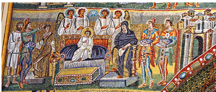
Închinarea Magilor, mozaic, sec. al V-lea, Basilica Santa Maria Maggiore, Roma.

Scena din catacomba San Callisto reia, într-o formă redusă Închinarea celor Trei Magi . Semnificative sunt fragmentele de vestimentație (bonetele frigiene), care, de altfel, se repetă ca un leitmotiv în toate aceste compoziții omonime. Fondul galben, ne duce, cu siguranță, cu gândul la fondul de aur al versiunilor viitoare, ce se vor încetățeni în canonul bizantin.