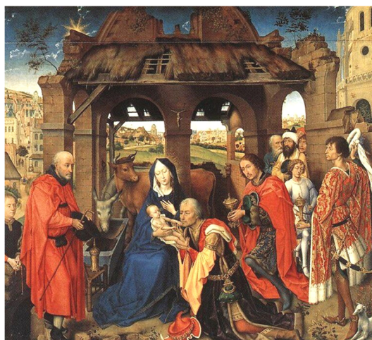
Van der Weyden, Tripticul Închinarea Magilor , ulei pe lemn, 1455-1460, Alte Pinakothek, München.

Deschizând o perspectivă amplă, Gentile da Fabriano, propune o scenă grandioasă ce dă posibilitatea etalării științei picturii, dar și a rezolvărilor plastice cu totul inedite și spectaculoase. Autorul depășește cadrul restrâns al tiparelor bizantine, transformându-l într-unul spațios, grandioase, prin prezența unui număr impresionant de figuri, animale și elemente de arhitectură. Accentul este dat de bogăția veșmintelor celor trei magi ce se disting în planul principal al lucrării. 11