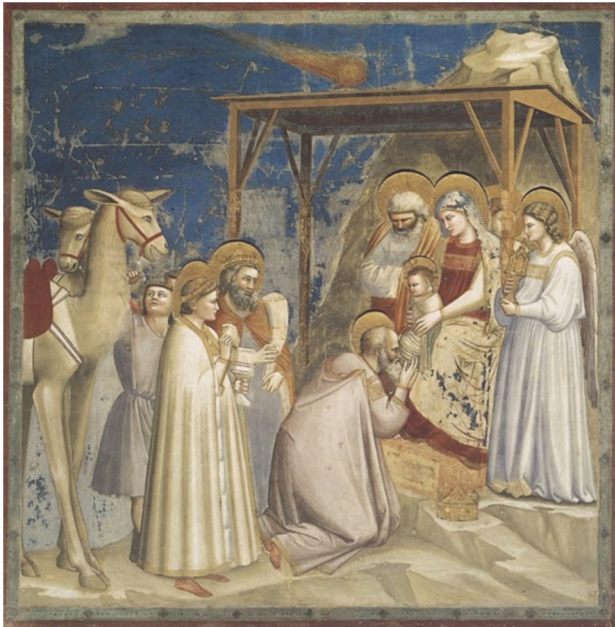
Giotto di Bondone, Închinarea Magilor , frescă, 1303-1305, Cappella degli Scrovegni, Padova.

Cu amprente mai directe spre eliberarea de canoanele bizantine se evidențiază mozaicul de la Santa Maria Maggiore a lui Pietro Cavallini. Mișcarea, dimpreună cu modelajul rafinat și pastelat al chipurilor, alături de perspectiva deschisă exprimă dorința de înnoire a creatorului.