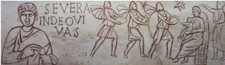
Severa și Închinarea Magilor, marmură, sec. al II-lea, Muzeul Pio Cristiano, Vatican.

Conform Bisericii Romano-Catolice, Melchior, Baltazar și Gașpar sunt considerați sfinți și sunt sărbătoriți pe data de 6 ianuarie. Numele crailor de la Răsărit a fost menționat într-o evanghelie a Bisericii Armeleşti, aici menționându-se și rangul lor: Melkon, Regele Persiei, Gaspar, Regele Indiei și Baltazar, Regele Arabiei. Relicvele celor trei magi sunt păstrate în Domul din Köln. 3