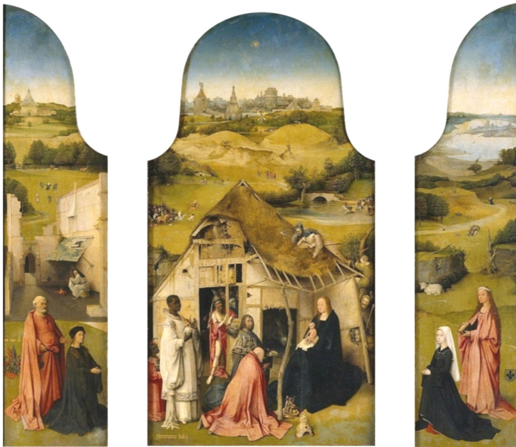
Bosch Jeronimus, Închinarea Magilor , tempera și ulei pe lemn, 1460, Metropolitan Museum of Art, New York.

Cu o vădită preocupare spre detaliile precis studiate ce sunt supuse prezentării unui public elevat și cunoscător spre închinare și admirație, Van der Weyden în faimosul triptic numit Adorarea Magilor , înfățișează tema evanghelică ca un fapt cotidian și contemporan lui. Bogăția și multitudinea elementelor dau măreție ansamblului. Roșul ce se întâlnește în mantilei celor două figure, dispuse simetric față de Fecioară, încadrează albastrul maforionului său, dând intensitate și individualitate temei.