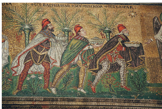
Închinarea Magilor, mozaic, sec. al VI-lea, Basilica San Vitale, Ravenna.