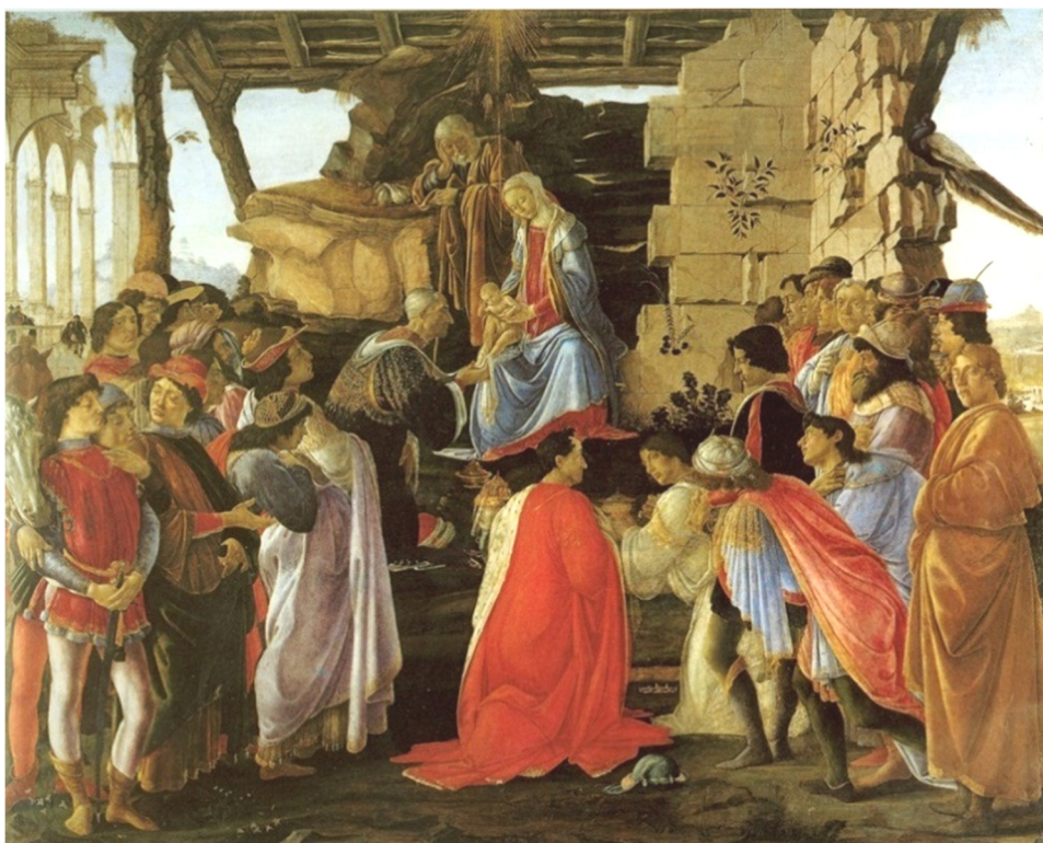
Sandro Botticelli, Închinarea Magilor , tempera pe lemn, 1475, Galleria degli Uffizi, Florența.

Construită pe schema piramidală, geniala compoziție a lui Botticelli de la Galleria Uffizi, cea din preajma anilor 1476-78 impresionează prin amploarea și grandoarea ei. Multitudinea figurilor ce fac parte din convoiul magilor magi sunt membri și prieteni ai nobilei familii de Medicii de la Florența. Artistul așează îngenunchiat pe bătrânul Cosimo Medici în locul magului vîrstnic. În partea de jos și în dreapta se observă alți doi bărbați prosternați; ei sunt Pietro cel Bătrân și Giovanni Medici, între care, în picioare se remarcă din profil Giuliano. Tot în planul principal, dar de data aceasta pe latura opusă, îl vedem sprijinit de o spadă pe Lorenzo Magnificul, el este îmbrățișat posibil de Angelo Poliziano, poetul. Contrastând cu ei în partea stîngă, cum privim, se evidențiază într-o tunica voluminoasă colorată în ocru, artistul însuși 13 .