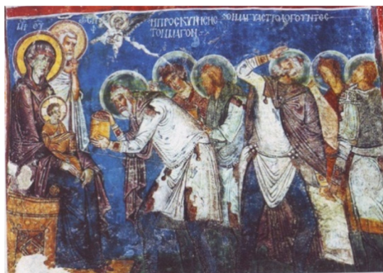
Închinarea Magilor , frescă, sec. al XII-lea, Capadocia.

Rangul, vârsta și locul lor de origine al magilor fiind nespecificate în surse evanghelice, literatura apocrifă și cea populară au fost libere să le atribuie cele mai diverse caracteristici multiplicând și numărul lor până la 12, precum apostolii. Din această cauză canonul picturii bizantine și post bizantine nu a stabilit un mod clar de reprezentare al magilor, limitându-le doar numărul la trei și atribuindu-le doar un rang înalt - mag sau crai, obârșie nobilă - sunt reprezentați călare, și bogăție - aduc daruri bogate. 10 Ei sunt înfățișați călărind spre peșteră (Matei 2, 9), urmând lumina Stelei călăuzitoare, sau oferindu-și darurile (Matei 2, 10-11).