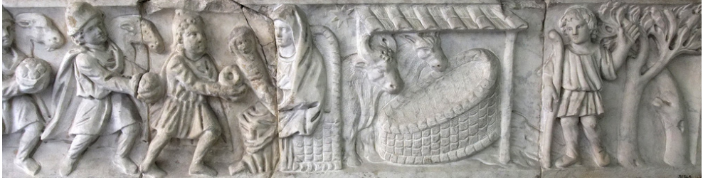
Închinarea Magilor , basorelief, sec. al IV-lea, Muzeul Vatican, Roma.

Compoziția narează plastic prezentarea darurilor de către Magi, Pruncului Sfânt și mamei Sale. Iisus apare înfășat în scutece și ținut în brațele Fecioarei. Craii sunt acompaniați de busturile în relief ale unor cămile. În spatele tronului Maicii Domnului se remarcă ieslea goală, conform Evanghelistului Luca (2, 12), secundată de cele două animale simbolice, boul și asinul. Flancând latura dreaptă a basoreliefului, Dreptul Iosif poartă un toiag înalt, evindețiindu-se cu mâna stângă ridicată.