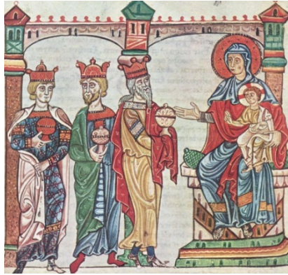
Închinarea Magilor , culori de apă pe hârtie, sec. al XIII-lea, Biblioteca Apostolica Vaticana, Vatican.

Manuscrisul de la Biblioteca Apostolica Vaticana aduce o notă distinctă în organizarea componistică a scenei, prin prezența coroanelor pe capetele Regilor veniți din Răsărit.