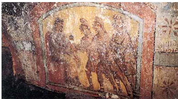
Închinarea Magilor, frescă, sec. al IV-lea, catacomba San Callisto, Roma.

Scena din catacomba San Callisto reia, într-o formă redusă Închinarea celor Trei Magi . Semnificative sunt fragmentele de vestimentație (bonetele frigiene), care, de altfel, se repetă ca un leitmotiv în toate aceste compoziții omonime. Fondul galben, ne duce, cu siguranță, cu gândul la fondul de aur al versiunilor viitoare, ce se vor încetățeni în canonul bizantin.