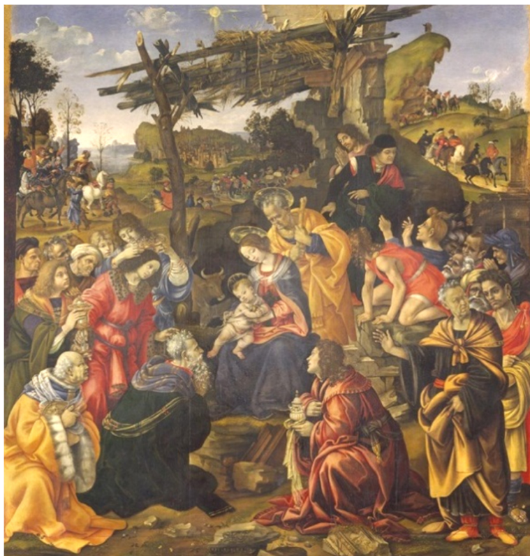
Filippino Lippi, Închinarea Magilor , ulei pe lemn, 1496, Galleria degli Uffizi, Florența.

Concepută în cadrul sărbătoresc inaugurat de Botticelli și influențată de tabloul rămas neterminat a lui Leonardo, Închinarea Magilor a lui Fra Filippino Lippi adăpostit tot la Uffizi a fost comandat de călugării de la Mănăstirea San Donato agli Scopeti de la Florența. În esență, scena se recompune în forma piramidală, atât de îndrăgită de artiștii renascentiști, cu toate că o anumită notă de lipsă de unitate și organizare caracterizează tabloul. Ca și în capodopera lui Botticelli, și în acest caz sunt importalizați membrii familiei Medicii, tabloul fiind o punere în scenă a unei multitudini de figuri ce se articulează în raport cu peisajul din planul al doilea a temei. 15