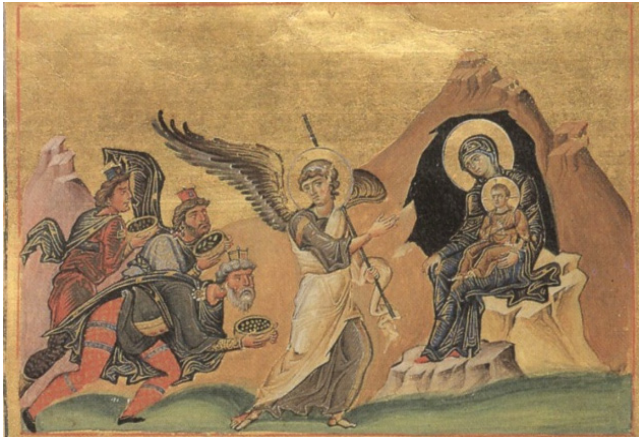
Închinarea Magilor , miniatură, sec. al X-lea, Menologul lui Vasile al II-lea, Biblioteca Vaticana, Roma.

În arta bizantină și post-bizantină tema Închinării magilor, apare adeseori inclusă în reprezentările Nașterii Domnului , dar poate fi reprezentată și individual. Ca temă individuală, are o structură simplă și directă: pe fundalul peșterii, sau al ieslei în ilustrațiile influențate de arta occidentală, Fecioara cu Pruncul în brațe este reprezentată așezată, ușor întoarsă spre cei trei magi prezenți în fața sa, care li se închină și le prezintă daruri. Această schema compozițională o întâlnim și în reliefurile antice, paleocreștine.