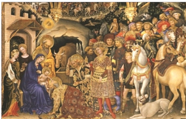
Gentile da Fabriano, Închinarea Magilor , tempera pe lemn, 1423, Galleria degli Uffizi, Florența.

Deschizând o perspectivă amplă, Gentile da Fabriano, propune o scenă grandioasă ce dă posibilitatea etalării științei picturii, dar și a rezolvărilor plastice cu totul inedite și spectaculoase. Autorul depășește cadrul restrâns al tiparelor bizantine, transformându-l într-unul spațios, grandioase, prin prezența unui număr impresionant de figuri, animale și elemente de arhitectură. Accentul este dat de bogăția veșmintelor celor trei magi ce se disting în planul principal al lucrării. 11