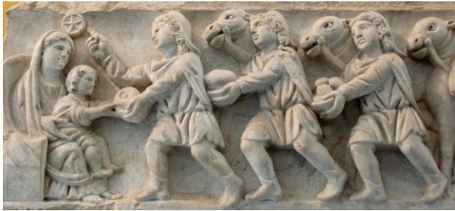
Închinarea Magilor , basorelief, sec. al IV-lea, Muzeul Pio Cristiano, Roma.

Compoziția narează plastic prezentarea darurilor de către Magi, Pruncului Sfânt și mamei Sale. Iisus apare înfășat în scutece și ținut în brațele Fecioarei. Craii sunt acompaniați de busturile în relief ale unor cămile. În spatele tronului Maicii Domnului se remarcă ieslea goală, conform Evanghelistului Luca (2, 12), secundată de cele două animale simbolice, boul și asinul. Flancând latura dreaptă a basoreliefului, Dreptul Iosif poartă un toiag înalt, evindețiindu-se cu mâna stângă ridicată.