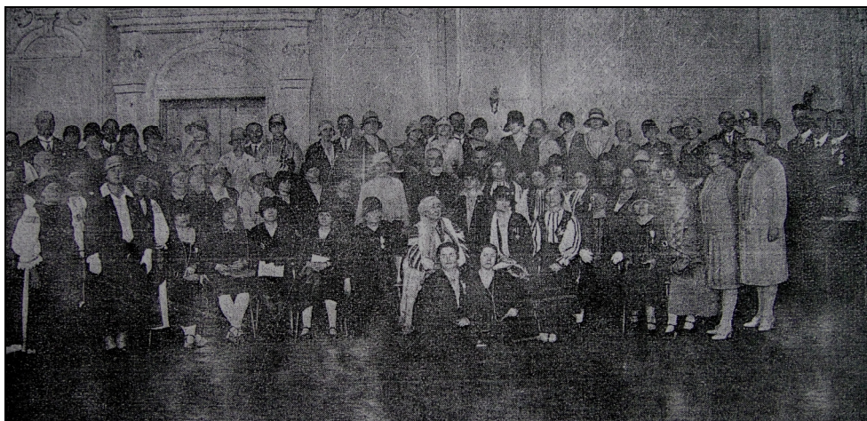
Fotografie cu Delegetele Soc. și Reuniunilor feminine din Transilvania la jubileul de 25 de ani de la întemeierea Reun. Sf. Maria 1902-1927